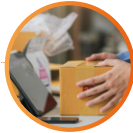
PRÉPARATION DES COMMANDES